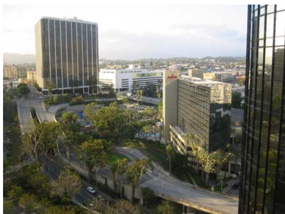
Udsigt fra hotelværelse

Min rejserapport er udformet som punkter under datoer, for hvilke workshops mv. jeg har deltaget i, så emnerne er lidt spredt, og jeg har som førstegangs deltager ikke kun koncentreret mig om Byg (BIM) ting, men også alm. microstation emner, som vel også er ok for BygSIG, dog har det mest været arkitekt-områder. Jeg håber på sigt, at blive bedre til også at varetage de andre områder inden for Byg. I rapporten har jeg ikke fortalt om udstillingsområde, ej heller om de aften-receptioner der var.